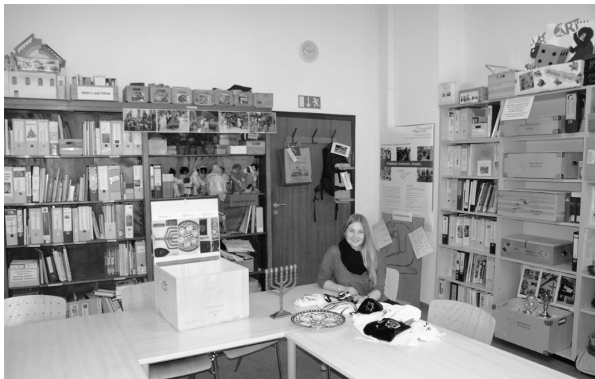
Abb. 1: Raum der Passauer Lernwerkstatt