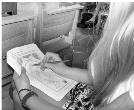
Abb. 4: Gestaltung eines Kirchenfensters (© Rudolf Sitzberger)

Im Gegensatz zum sehr theoretisch angelegten Lernprozess in der Vorlesung wechselt das Setting in der wissenschaftlichen Übung. Die im Idealfall aus der Vorlesung schon bekannte Theorie wird in hier nur noch kurz entfaltet. Mit einem Lernortwechsel werden nun der didaktische Ansatz und die zugehörigen Methoden vor Ort in einer konkreten Kirchenraumerkundung von den Teilnehmenden selbst erprobt (siehe Abb. 3 und 4). Dabei wird darauf geachtet, dass für die unterschiedlichen Lehrämter auch unterschiedliche Konzepte bereitgestellt werden. In der Kirchenraumdidaktik wird der schulische Kontext besonders betont, d. h., dass die Anbindung an einen konkreten Lernbereich einer Jahrgangsstufe maßgeblich für die Ausgestaltung der Kirchnerkundung sein muss. So bilden sich unterschiedliche Kleingruppen, die die Arbeitsaufträge anschließend gemeinsam und/oder einzeln bearbeiten. Die Aufgaben sind so gestaltet, dass sie einerseits für die Studierenden vom Niveau her passen, andererseits auf Kinder oder Jugendliche hin abgewandelt ebenso in der Schule einsetzbar wären. Im eigenständigen Erproben religionsdidaktischer Methoden können die Studierenden leichter erkennen, welche Schwierigkeiten sich in den Aufgabenstellungen