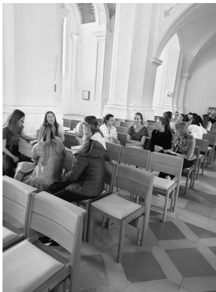
Abb. 3: Arbeitsgruppen im Kirchenraum