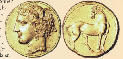
Abb. 3 Punische Münze (260-240 v. Chr.): Avers: karthagische Fruchtbarkeitsgöttin Tanit; Revers: Pferd als mythisches Gründungssymbol der Stadt Karthago

„Weltgeschichtliche Bedeutung gewinnt der Vorgang [die Vernichtung Karthagos, Anm. d. A.] erst durch die darauffolgende Phase relativer innerer wie äußerer Stabilität, in der weite Teile der römischen Welt eine bis heute richtungweisende politische und kulturelle Prägung erhielten.“ (Zimmermann, Rom und Karthago , S. 146)