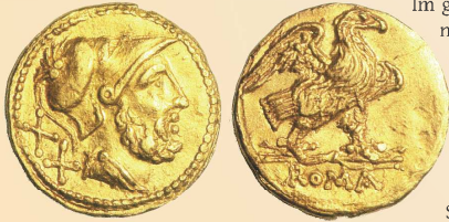
Abb. 2 Römische Münze (211-209 v. Chr.). Avers: Kopf des Kriegsgottes Mars; Revers: Adler auf einem Blitzbündel stehend, beides Attribute von Zeus

Im gleichen Jahr unternimmt dieser einen Gewaltmarsch über die Alpen, auf den die Römer nicht vorbereitet sind. Infolge militärischer Fehlkalkulationen haben die Römer Heere nach Spanien und Sizilien entsandt und sind in Italien vergleichsweise schutzlos. Nachdem Hannibal die Schlachten an der Trebia in Norditalien (218), am Trasimenischen See (217) in Mittelitalien und bei Cannae (216) in Süditalien für sich entschieden hat, scheint das Schicksal Roms besiegelt. Doch hat Hannibal die Loyalität der Bundesgenossen unterschätzt.