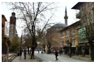
Die Altstadt von Priština

Folgende Hauptziele liegen auf der Reiseroute: